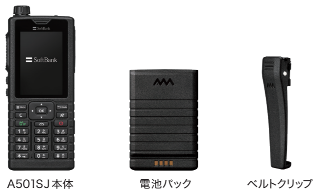
A501SJ本体 電池パック ベルトクリップ