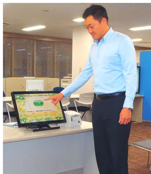
発券操作イメージ(弊社社員)

人口 42 万人、世帯数 18 万を超える藤沢市役所様では、マイナンバー「個人番号カード」の申請受付を 2015 年 10 月から、交付を 2016 年 1 月から実施するにあたり、特設窓口（ココテラス湘南）を開設し、日々 300～400 件もの窓口対応を予定されております。