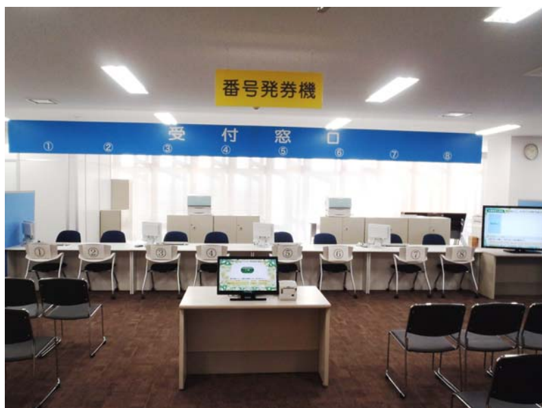
多機能発券機システム『悟空』設置状況 (藤沢市様マイナンバー特設窓口)

西菱電機株式会社（本社：兵庫県伊丹市、代表取締役社長：西岡伸明）は、マイナンバー「個人番号カード」の申請・交付窓口の混雑を緩和し、市民サービスの向上にも寄与する多機能発券機システム『悟空』を神奈川県藤沢市役所様に納入しました。