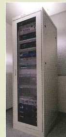
防災情報配信システム

地域住民から電話やFAXで通報があった場合、管理者に通知メールを自動配信します。