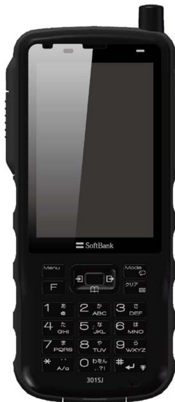
「IP 無線機 SoftBank 301SJ」

西菱電機とソフトバンクテレコムは、お客さまのニーズにお応えする携帯電話網を活用した業務用無線サービスの提供に努めてまいります。